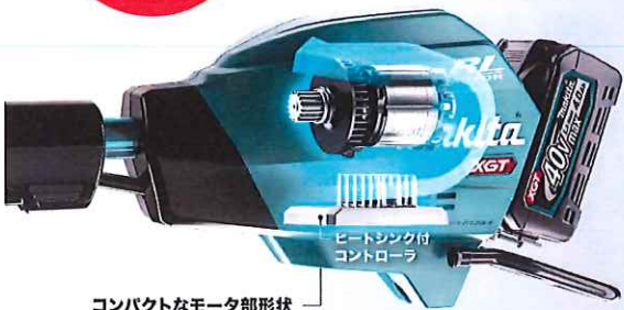
コンパクトなモータ部形状